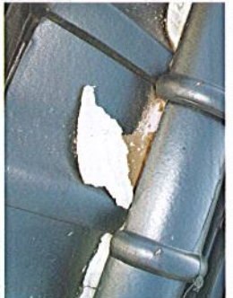
雪(ゆき)が取れている