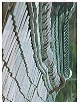
雪が曲がっている